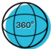
Visite de l'atelier

En magasin (ou sur le net), vous assurez la vente de vélos, des services et des produits (accessoires, produits additionnels) auprès de la clientèle.